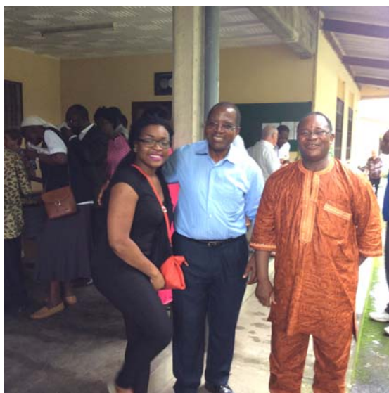
La joie de partager ensemble

Être compagnon du Christ ou plus précisément devenir disciple du Christ, c'est « laisser les morts enterrer leurs morts » (Mt 8, 22), c'est-à-dire entrer dans la culture de la vraie vie que le Christ nous communique ; c'est laisser derrière nous nos pleurs, nos peurs, nos lourdeurs, nos hésitations et tout ce qui nous empêche de vivre heureux dans la vigne du Seigneur. L'unique urgence pour chacun de nous, c'est