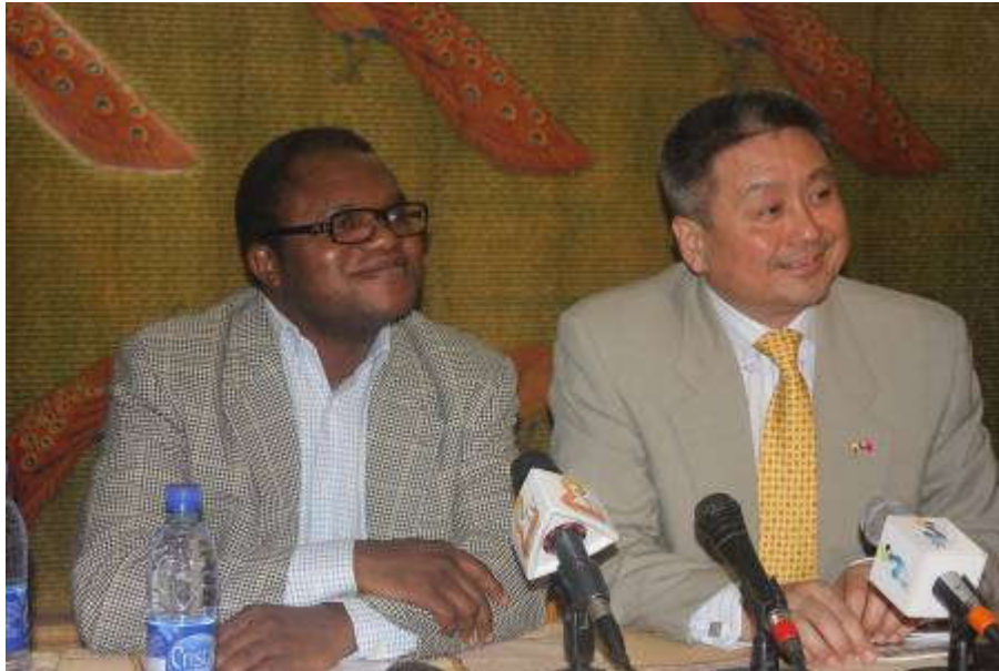
Le Directeur Général du CEFOD et S.E.M. l'Ambassadeur de la Chine Populaire au Tchad face à la presse

d'une Banque tchadienne de données juridiques qui renferme tout ce que le Tchad a comme législation, textes réglementaires et jurisprudentiels.