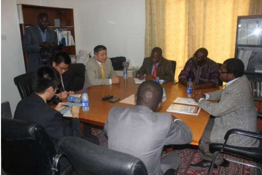
Séance de travail entre le staff du CEFOD et la délégation hôte

Après avoir tendu une oreille attentive, S.E. Hu Zhiqiang a promis de voir ce qui peut être entrepris dans la mesure du possible. Il a procédé à la remise des dons de matériels de bureau constitués d'ordinateurs portables, d'enregistreurs et d'appareils photos numériques ainsi que des ouvrages destinés au centre de documentation du CEFOD. Il a promis d'alimenter dans l'avenir la bibliothèque du CEFOD avec des ouvrages sur l'expérience chinoise en matière d'énergies renouvelables, d'environnement, de droit international, etc.